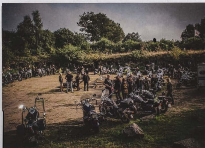
75 personer samlades i Grottnbyn. 53 hojar bildade en "vagnborg" som i en gammal John Ford-western.